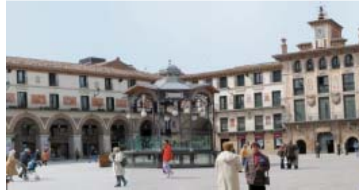
Plaza de los Fueros, centro neurálgico de la ciudad.