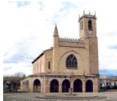
Iglesia junto a la que se representa el "Misterio de Obanos".

Muy conocida es también la historia de San Guillén y Santa Felicia, que se representa en el denominado "Misterio de Obanos". Felicia realizó el Camino de Santiago y a su vuelta renunció a sus privilegios como princesa de Aquitania y se quedó a servir en Amocáin (pueblo del Valle de Egúés). Su hermano Guillén, al no convencerla para regresar, le dio muerte y arrepentido peregrinó a Santiago y de regreso se recluyó en la ermita de Arnotegui.