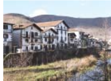
Casco urbano de Elizondo, en la ruta alternativa de Baztan.

Arizkun, Elizondo, Elbetea, Irurita y Berroeta-, un paraíso verde en el que no faltan los palacios de característicos sillares rojos. Antes de unirse en Arre con la ruta procedente de Orreaga/Roncesvalles, el camino sube y desciende el puerto de Belate.