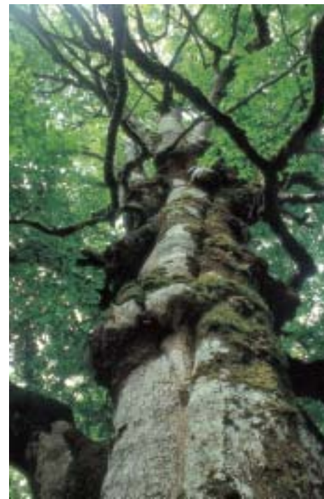
Haya centenaria en Urbasa

el bosque y el raso y parajes como las fuentes de los Mosquitos, Gortasoro y Arafe, el Haya de la Virgen, el Raso de Udabe y la majada pastoril. Paseo al Nacedero del Urederra: del aparcamiento existente pasado el pueblo de Baquedano, parte un sendero bastante llano hacia el Nacedero del Urederra (2 horas ida y vuelta). El camino, con frecuencia bastante húmedo, discurre junto al río y llega hasta su nacimiento de la roca